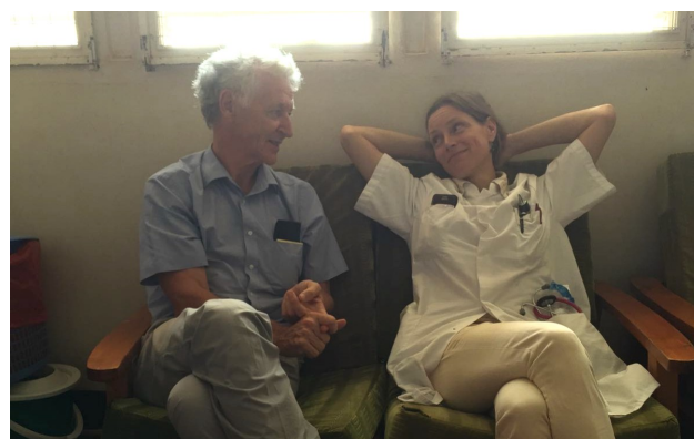
Met William, de twee neurologen van Tanzania

blij met de jas die ik meegegrist had, en met de wollen trui en deken voor de patiënt. Het ziekenhuisje heeft een goede orthopeed en een stokoud maar werkend röntgenapparaat, en dat was op dat moment alles wat we nodig hadden. Toen we met radioloog en orthopeed naar de breuk stonden te kijken op de nog drogende film, vertelde de ziekenhuismanager, een Amerikaanse Mormoon die al decennialang het ziekenhuis draaiend houdt, dat ze in het ziekenhuis soms stilletjes wat extra diensten leveren. Onderaan de berg zit namelijk een dierenartsenpraktijk met ongebruikelijke klandizie, waarvoor soms wat extra diagnostiek nodig is. Zo had de tafel (waar net mijn patiënt nog op lag) apen, cheeta's en maraboes met gebroken poten langs zien komen voor diagnostiek. Ik vind dit soort details prachtig.