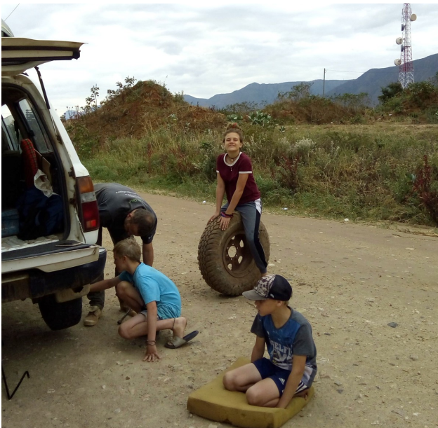
Autopech, aflevering 238

Dit is een van mijn laatste stukjes in de nieuwsbrief, omdat ik de volgende 2 jaar in