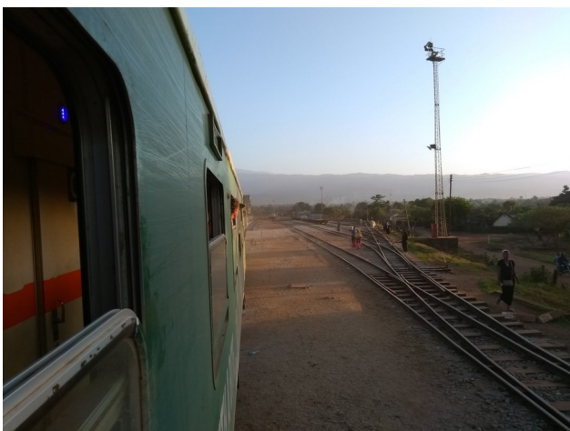
Na 16 uur in de trein vanuit Dar es Salaam (600km), aankomst op station Moshi

[Net 16 geworden, met een groot tuinfeest. Is inmiddels net een tikje langer dan Ida en haalt haar moeder binnenkort ook in.]