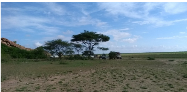
Kampeertrip Enduimet - we kwamen 's ochtends de leeuw in tegen die we 's nachts hadden horen brullen