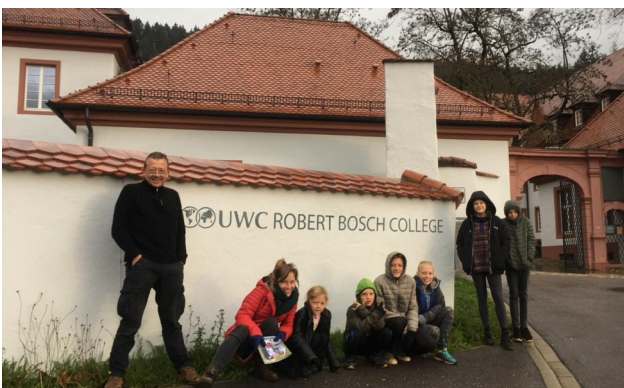
Voor de ingang van het UWC in Freiburg toen we er in december 2019 met de camper langs reden