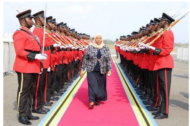
De nieuwe president, Mama Samia, bij haar aantreden

Hoeveel er kan veranderen in drie maanden! Kort na onze vorige nieuwsbrief overleed de president wiens beleid – om het voorzichtig uit te drukken – ons steeds meer zorgen baarde. Dit was daags nadat hij, na weken onzichtbaar te zijn geweest, volgens de regeringswoordvoerder “te druk aan het werk was om in publiek te verschijnen”. Zijn positie werd, zoals grondwettelijk bepaald, overgenomen door de vice-president, Samia Suluhu Hassan, ofwel “Mama Samia” in de volkmond. Een vrouw die bijna het tegenovergestelde is van de voormalige president: bedachtzaam, diplomatiek, medemenselijk, en met veel (ook internationale) politieke ervaring.