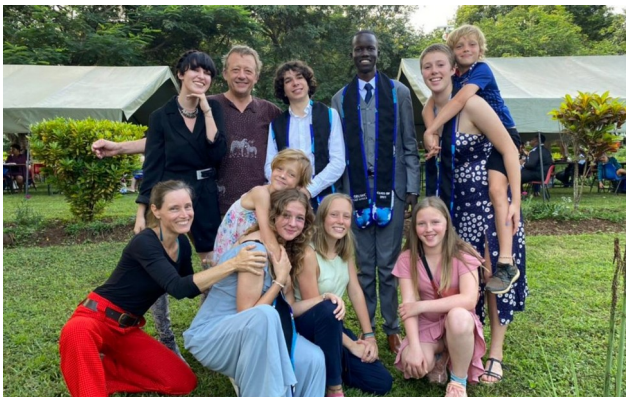
Met onze "extended family" van UWCEA leerlingen

Hoe politiek gebruikt wordt om informatie te verhullen en te verdraaien. Dat alles gaat allemaal misschien nog goedkomen met de nieuwe presidente, al zal dat stap voor stap moeten. We juichen zachtjes, maar willen dat vooral niet te vroeg doen.