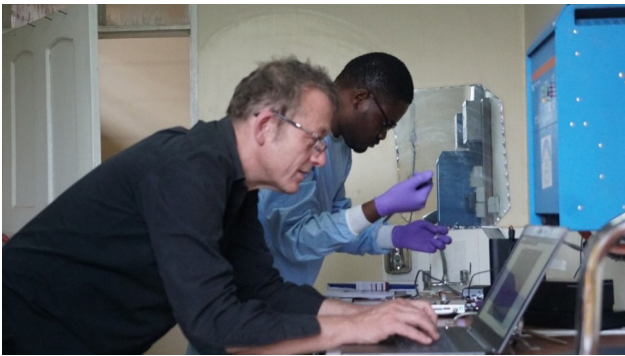
Aan het werk in een geïmproveerd lab: de eersten om in Tanzania SARS-CoV-2 te sequencen

die een ommekeer betekenen: betere relaties met buurlanden, samenwerking met internationale instanties, economische stimulering inclusief het aantrekken van buitenlandse investeerders (en een verbod voor de belastingdienst om nog langer militaire invallen te doen bij – vooral buitenlandse – bedrijven, en de exorbitante boetes te heffen die menig bedrijf de das om deden of het land lieten verlaten). Niet te vergeten: erkenning van de Covid-pandemie, zodat mensen kunnen rouwen om degenen die ze verloren hebben. Mama Samia kondigde zelfs de terugkeer van persvrijheid aan, al werd dit daags erna “rechtgezet” (de veiligheidsdiensten hebben nog altijd een grote vinger in de pap): ze had alleen gedoeld op online televisie. Hoeveel mensen zouden online tv kijken in Tanzania?