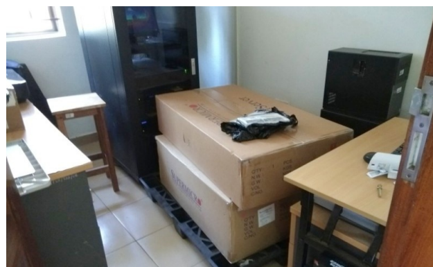
De twee servers die mijn bioinformatica cluster compleet maken wachtend op installatie

nevenactiviteiten een vorm van inkomensverzekering. Dat wil zeggen, zolang ze niet ten koste gaan van elkaar, en dat is toch wel een probleem.