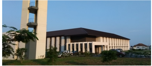
Het Noguchi Advanced Research Lab in Ghana

Het verkeer is een wereld van verschil met Moshi of Dar, en waarschijnlijk draagt daar in belangrijke mate aan bij dat bestuurders in Ghana daadwerkelijk een rijbewijs gehaald hebben. Ik liet aan mijn cursisten een Instagram foto zien die Doris had door-gestuurd, van een geldbiljet van TSh 10.000 (€3,75), met daarboven de tekst “Tanzaniaans rijbewijs”. De Nigeriaanse cursisten begrepen de grap onmiddellijk, maar aan de Ghanezen moest ik uitleggen dat je voor dit bedrag ofwel een rijbewijs kan kopen, dan wel twee keer een bekeuring kan afkopen bij een politieagent. De reactie van mijn Ghanese cursisten was “nee, dat meen je niet!”. Corruptie in Ghana is – aldus hen – niet het enorme probleem dat het is in veel andere Afrikaanse landen.