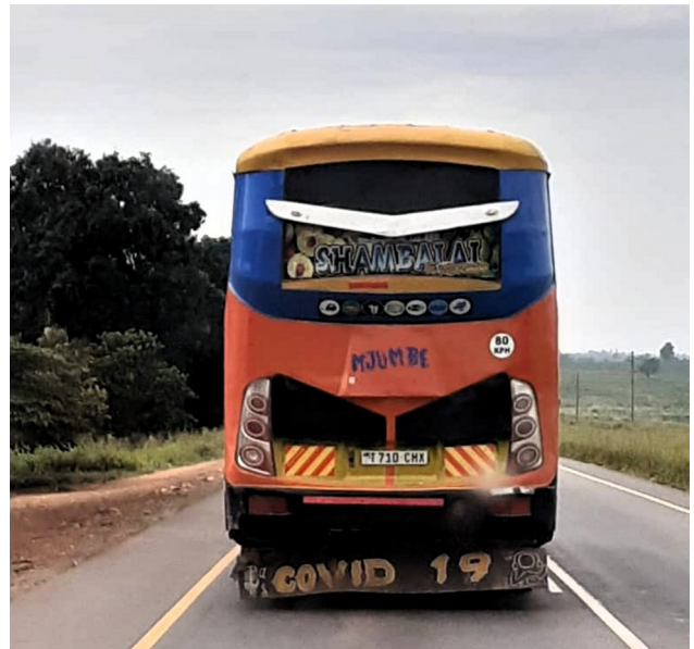
Uit onze verzameling "opvallende belettering": zie de tekst op de spatlap!

Het continent heeft nauwelijks revalidatiezorg. Revalidatiegeneeskunde wordt gedaan door de artsen die betrokken waren bij de behandeling, in nauwe samenwerking met de fysiotherapeuten en ergotherapeuten. Reva-