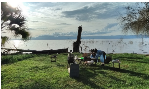
Field sequencing op de oever van Lake Eyasi

Twee van de samples die we onderzochten waren van kinderen met diarree. De uitdaging was om zonder eerst een kweek te doen, direct de veroorzaker te vinden. In beide gevallen konden we de diagnose nog dezelfde dag stellen: Campylobacter , een bacterie die moeilijk te kweken is. We konden de artsen ook vertellen welke antibiotica het best voorgeschreven kon worden. Het is vooralsnog verre van economisch om dit soort diagnostiek met DNA sequencing te doen, maar ons doel was om te laten zien dat deze technologie niet meer voorbehouden is aan geavanceerde centrale onderzoekslaboratoria, en hierin slaagden we: we deden de analyses ter plekke, in de open lucht.