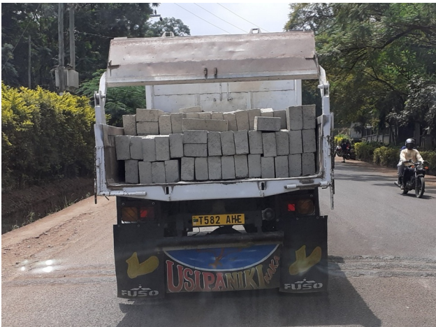
Tekst op de spatlap is "usipaniki": "geen paniek!"