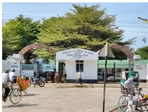
Het regionale ziekenhuis in Tabora

Het tweede team, dat naar Mwanza was gereisd om (tevergeefs) in Lake Victoria te zoeken naar sporen van cholera, ontmoette ons na ruim 800 km weer in Tabora, een van de meest afgelegen labs in het project. Hier sequenceten we, naast een laboratorium dat een eeuw geleden door de Britten gebouwd werd voor onderzoek naar slaapziekte, samples van een recente meningitisuitbraak.