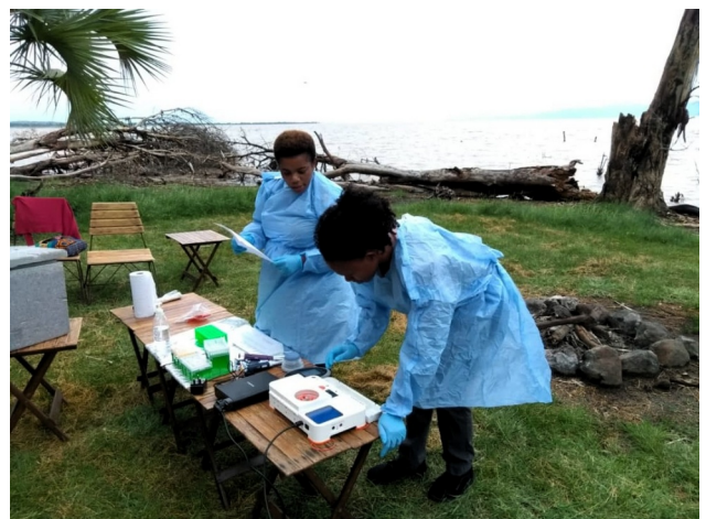
Collega's Happiness en Mariana aan het werk in het "veldlaboratorium"

We hebben de watermonsters dus overgeslagen, maar hebben desondanks letterlijk "in het veld" samples gesequenced, met een klein draagbaar "laboratorium in een koffer", een DNA sequencer ter grootte van een USB stick, en een laptop.