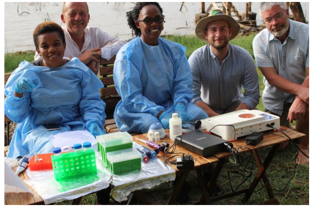
SeqTanzania Team 2

In dit nieuwe project gaan we bij onderzoekslaboratoria en ziekenhuizen verspreid over Tanzania mobiele DNA sequencing labs opzetten. Met deze labs kan ter plekke de verspreiding van antibioticaresistentie gevolgd worden, en kunnen uitbraken van infectieziekten onderzocht worden. De nieuwe technologie betekent voor de labs een enorme sprong vooruit, en er is veel animo voor